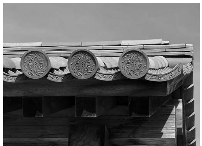
▲屋根に用いられた飛雲文軒瓦