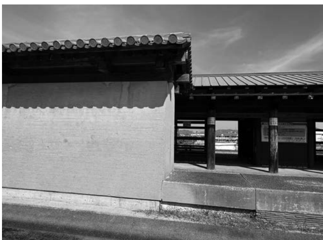
▲復元された政庁東脇殿の築地塀