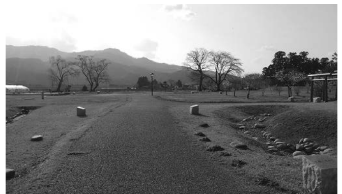
▲大手門跡より城内と西方の金峰山を望む(2019年4月6日)